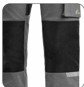
kolena zesílena 600D polyesterem kolená vystužené polyesterom 600D knees reinforced by 600D polyester kolana wzmacnione poliestrem 600D